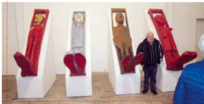
Der var tale om stor kunst og store indtryk i Carlshütte - og store fødder!