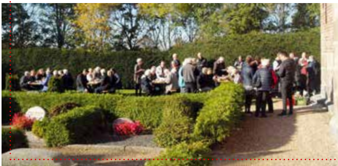
Høsten blev fejret af børn i Døstrup Kirke og af voksne i Mjolden Kirke.