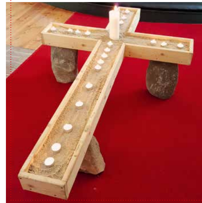
Alle helgens dag blev der tændt lys og tænkt kærligt i begge kirker.