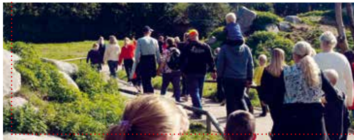
Der var mange gode dyreoplevelser for små og store i Givskud Zoo.