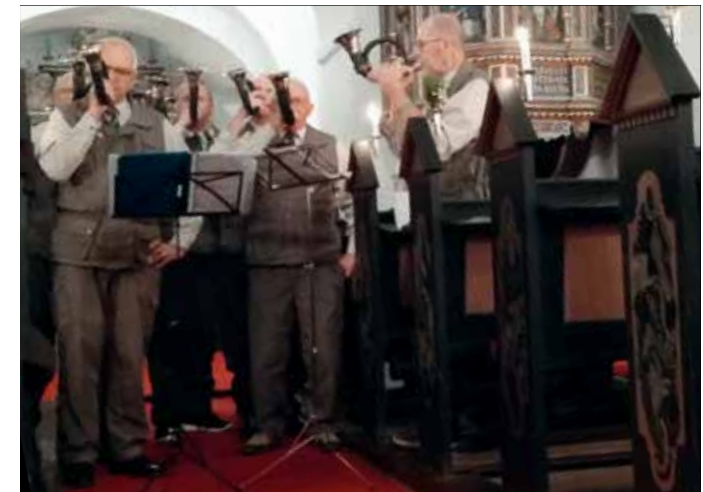
Jagthornsblæserne gjorde jagtgudstjenesten til en festlig oplevelse.