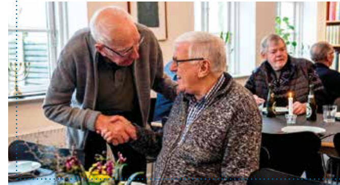
Herreværelset byder på frokost, god snak og gensynsglæde.