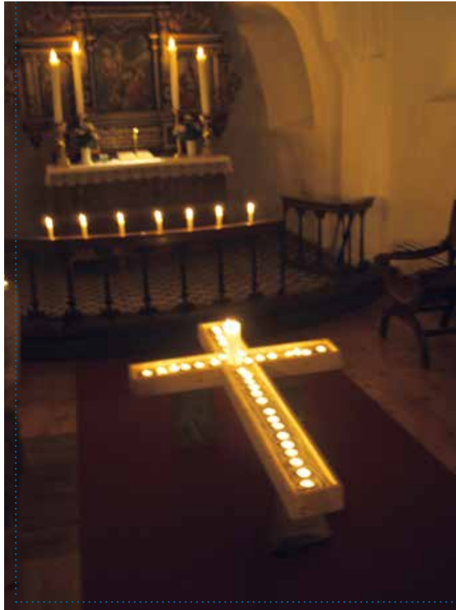
Konfirmanderne bar lys ind og lyskorsene blev tændt i begge kirker.