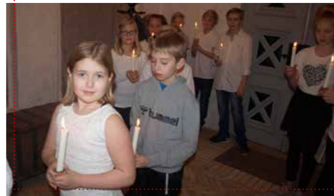
Børnene er klar til at bære julelys ind i Døstrup Kirke.