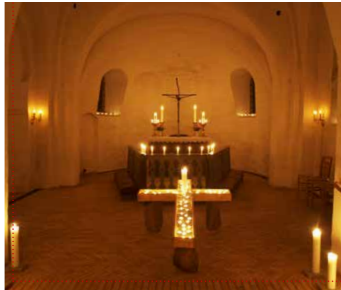
Alle fik mulighed for at tænde lys og sætte det i lyskorset.