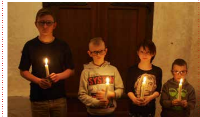
Børnene er klar med lys i Mjolden Kirke. Også lyskorset blev tændt.

Fra påskedag til og med trinitatis søndag vil det liturgiske led kyrie og gloria indgå ved gudstjenestens begyndelse.