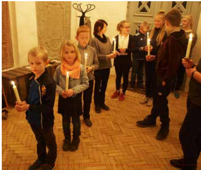
Kyndelmisse i Døstrup Kirke – gå i lyset med mørket!