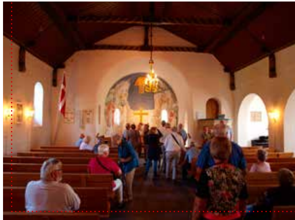
Sogneudflugten indledes i Rødding Frimenighedskirke.