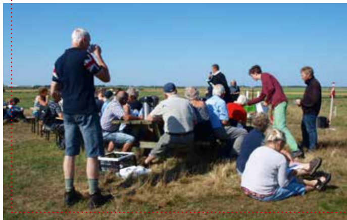
Kaffe og gudstjeneste på Ålebjerget.