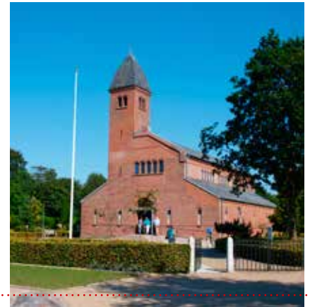
Afslutningsandagt i Askov Kirke.