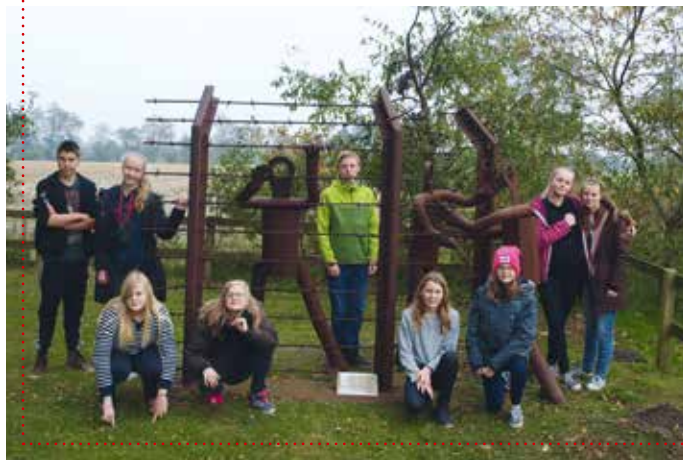
Konfirmanderne besøger kz-mindesmærket i Ladelund.