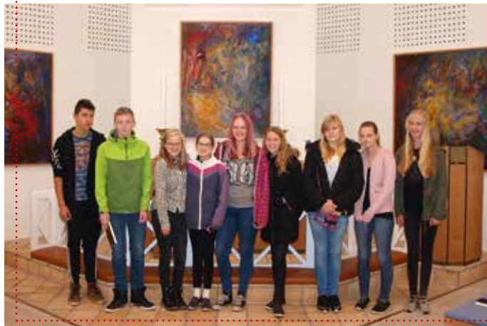
Konfirmanderne besøger den danske kirke i Harreslev.