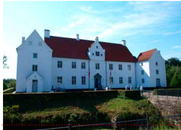
Og så gik turen til Sønderkov Slot.