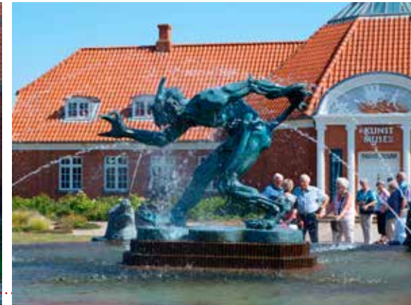
Trold vejrer kristenblod ved Vejen Kunstmuseum.