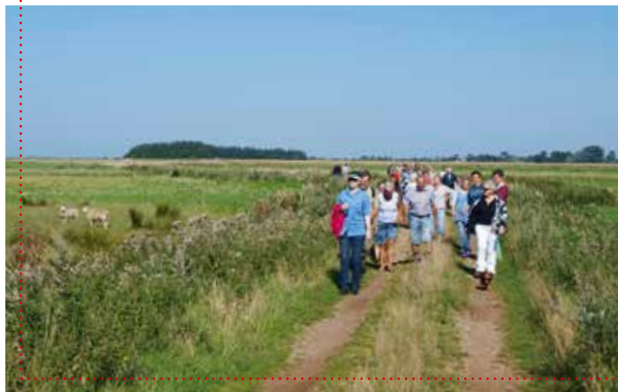
Det er sommer, sol, søndag og gå-gudstjeneste.