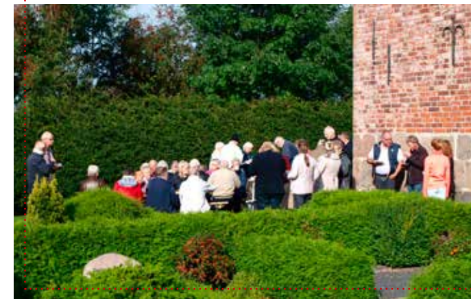
Høstgudstjeneste for voksne – den gammeldags æblekage nydes.

Nytårsdag, fredag d. 1. januar kl. 16.00 holdes der nytårgudstjeneste i Døstrup Kirke. Efter gudstjenesten vil der være kransekage og lidt at drikke i Café Laurentius. Denne gudstjeneste går som bekendt på skift mellem de to kirker og alle fra begge sogne er meget velkomne til at ønske hinanden godt nytår!