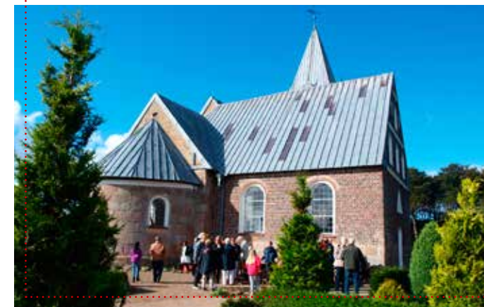
Høstkirkekaffen indtages i det fri – som noget nyt på kirkegården.