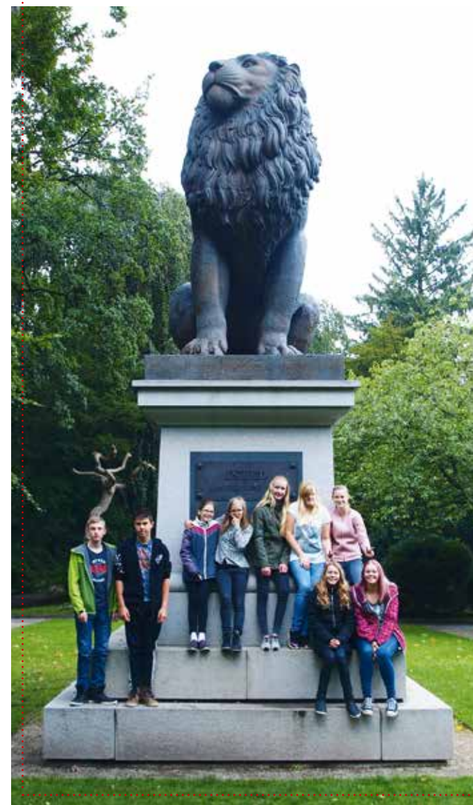
Istedløven i Flensborg får besøg af historiebegærlige konfirmander!