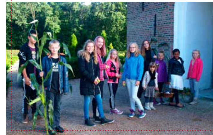
Høstgudstjeneste for børn – hvornår må vi gå ind?