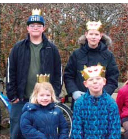
Konger og dronninger.