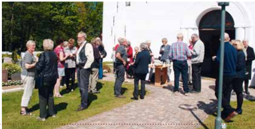
Sognernes gudstjenesteudflugt til Rømø Kirke.