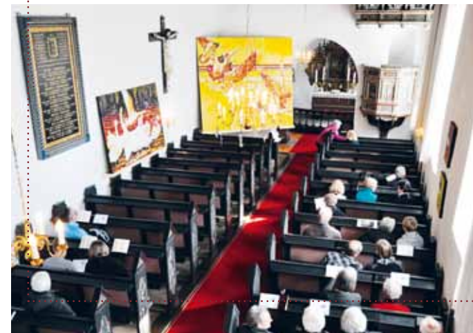
Fuglegudstjeneste i Mjolden Kirke.