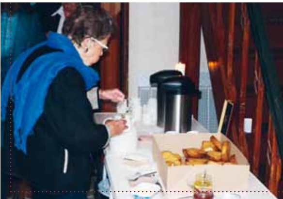
Varme hveder i Mjolden Kirke.