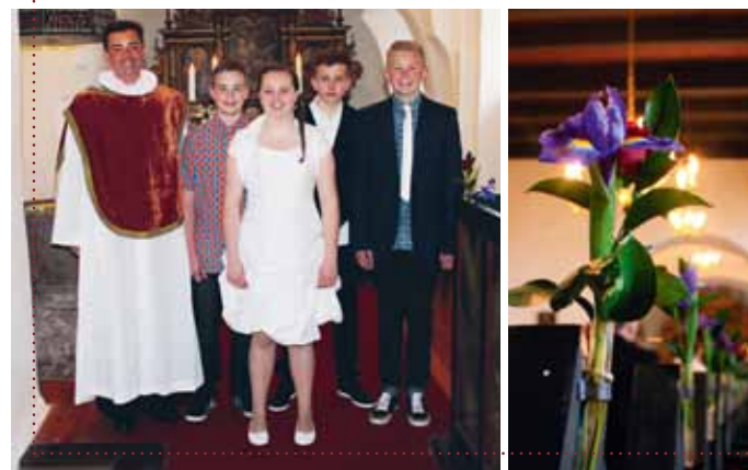
Mjolden Kirkes glade konfirmander.