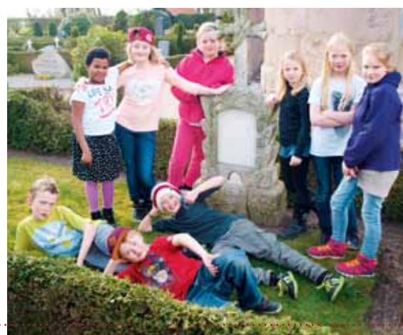
Forårets friske mini-konfirmander.