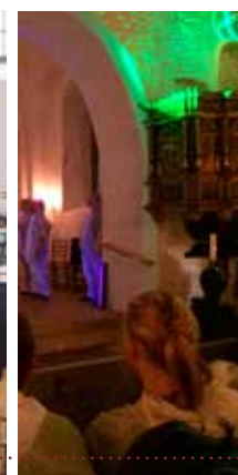
Lyd og lys.