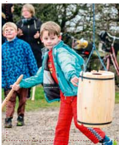
Så skal den bare ha'!

Også i år afholdes der fælles sogneudflugt, nemlig lørdag d. 6. september, hvor alle er meget velkomne. Der er i lighed med de foregående år afgang kl. 8.45 fra Mjolden Kirke og kl. 9.00 fra Døstrup Kirke og hjemkomst kl. 17.00 i Døstrup og kl. 17.15 i Mjolden. I år går turen i anledning af 1864 til Dannevirke og efter en god frokost til Slesvig Domkirke, hvor en dansktalende guide tager imod os. Prisen, der dækker bus, frokost og udflugtsmål er kr. 50,-, der betales ved tilmelding, der foretages til sognepræsten (kan gøres allerede nu). På den anden side af sommerferien følger endnu mere information i dagspressen og i BLADET. Men sæt allerede nu kryds i kalenderen og se frem til en dag med oplevelser og fællesskab!